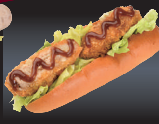
9 桃豚コロッケドッグ