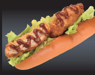
10 桃豚メンチカツドッグ