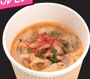
5 桃豚煮込みホルモン(ブラック)

やわらかな桃豚のホルモんに、ガーリックを効かせました。しょうゆと味噌風味の煮込みホルモン「ブラック」。