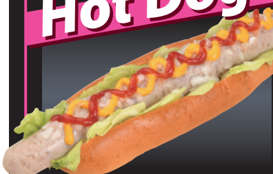
8 桃豚ビッグドッグ

超ロングなソーセージを挟んだ、食べごたえ満点なビッグドッグ。ドッグパンとの相性もバッチリです。