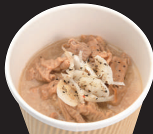
6 桃豚煮込みホルモン(ピンク)

やわらかな桃豚のホルモンをトンコツのスープで煮込みました。マイルドなゴマ味噌味の煮込みホルモン「ピンク」。