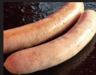
7 桃豚焼きソーセージ

ドイツでは定番のソーセージ。塩や香辛料を本場ドイツから取り寄せて作りました。肉汁たっぷりです！